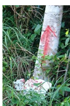
↑看板には「屋良部岳頂上まで約7分」