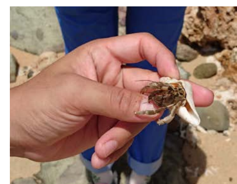
↑引きこもったやどかりに、ハ〜っと息を吹きかけると出てくるという裏技。

さて、メインの「お手軽山登り（3才でも大丈夫だよ〜）」の登山口に到着！って、いきなり車を止められたけど、どこ！？はっ、よく見ると、道路の路肩に少しだけ草が茂っていない部分が…。さらによく見たら木に登山口の矢印が書いてる！（笑）