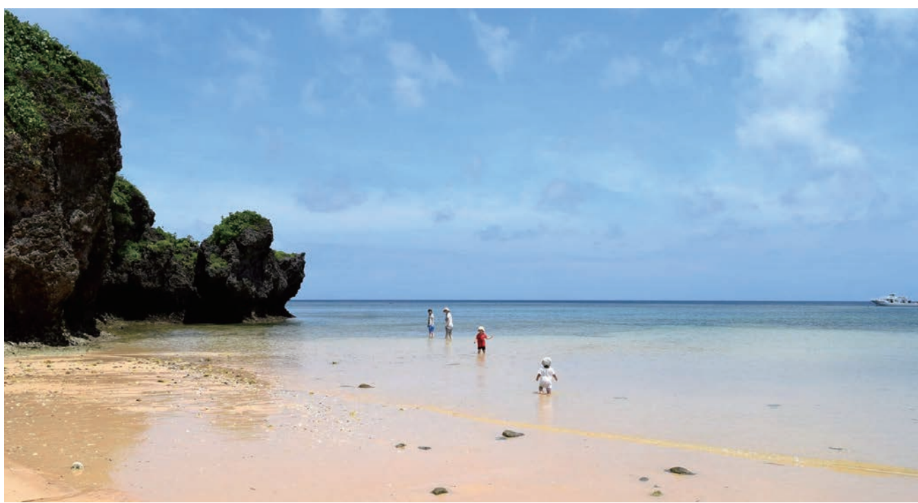
こんな景色…！ほぼプライベートビーチ！！ @崎枝ビーチ