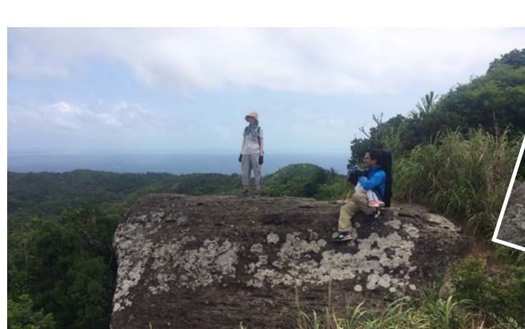
↑少し高所恐怖症なオイケもさすがに絶景だったので、ちゃんと岩に登れました。（ガイドしてくれた旦那さんは赤ちゃんだっこしながらの登山！すごい！）