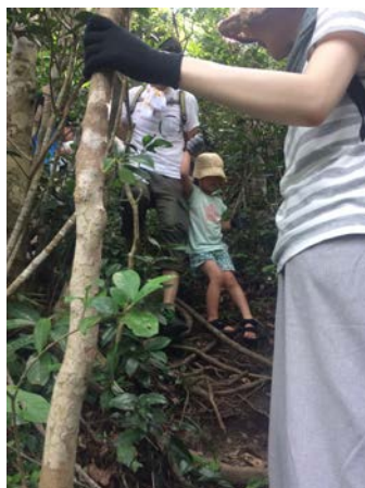
↑こんな山登りって聞いてへんで…（3才児談）