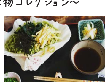
八重山そば(すべての八重山そばが貝に入っているわけではないです…)