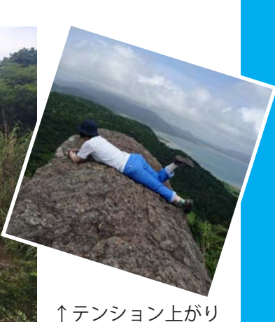
↑テンション上がりまくる友だち…