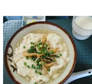
ゆし豆腐。これは下に麺が入ってるバージョン。やさしいお味でうまー