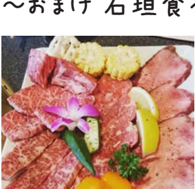
いわずもがなの… 石垣牛!!!