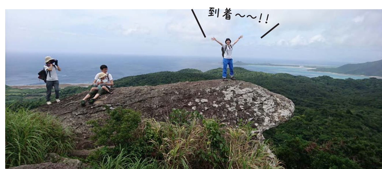
絶景！！遠くにはあの有名な川平湾まで見渡せる！ @屋良部岳